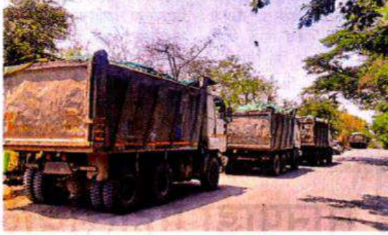
नवी मुंबई : सिडकोने डेब्रिज टाकणारे डम्पर जप्त केले आहेत.

मुंबईसह आजूबाजूच्या परिसरात मोठ्या प्रमाणात विकासकामे सुरु आहेत. येथील डेब्रिज काही व्यक्तींकडून सिडकोने नवी मुंबई आंतरराष्ट्रीय विमानतळ प्रकल्पासाठी संपादित केलेल्या जागेमध्ये तसेच त्याच्या आजूबाजूच्या परिसरामध्ये अनधिकृतपणे टाकण्यात येत आहे. मातीचे उत्खनन करून त्याचीदेखील